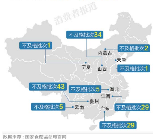
11 月份以来各省市桶装水检出铜绿假单胞菌统计

2015 年 5 月 24 日实施的新饮用水标准 GB19298-2014《包装饮用水》明确规定每 250mL 水样中铜绿假单胞菌不得检出，并且要求出厂前对每批次成品进行铜绿假单胞菌检测。如果检出，则为不合格产品，应该召回和停止销售。