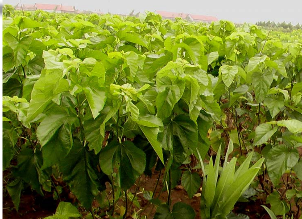
桑蓊马各代若虫出现时期